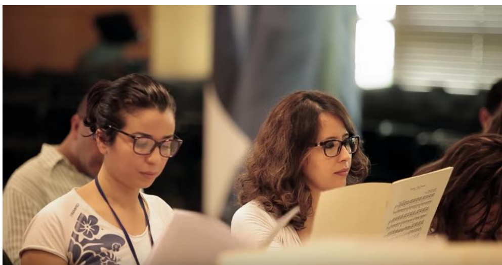
Dans les coulisses de Playing for Philharmonie de Paris

Aperçu du Choeur des Fileuses chanté par les choristes @MecenatMusical interprété par @LesSiecles dirigé par @fxrroth #playingForPhilharmonie — Mohammed Bensoltana ( @simobenso )